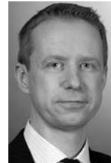
Holger Leppin, Fonds Media GmbH, Hamburg