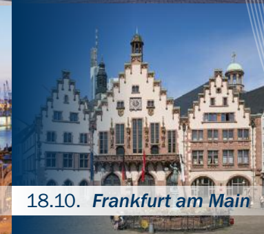
18.10. Frankfurt am Main